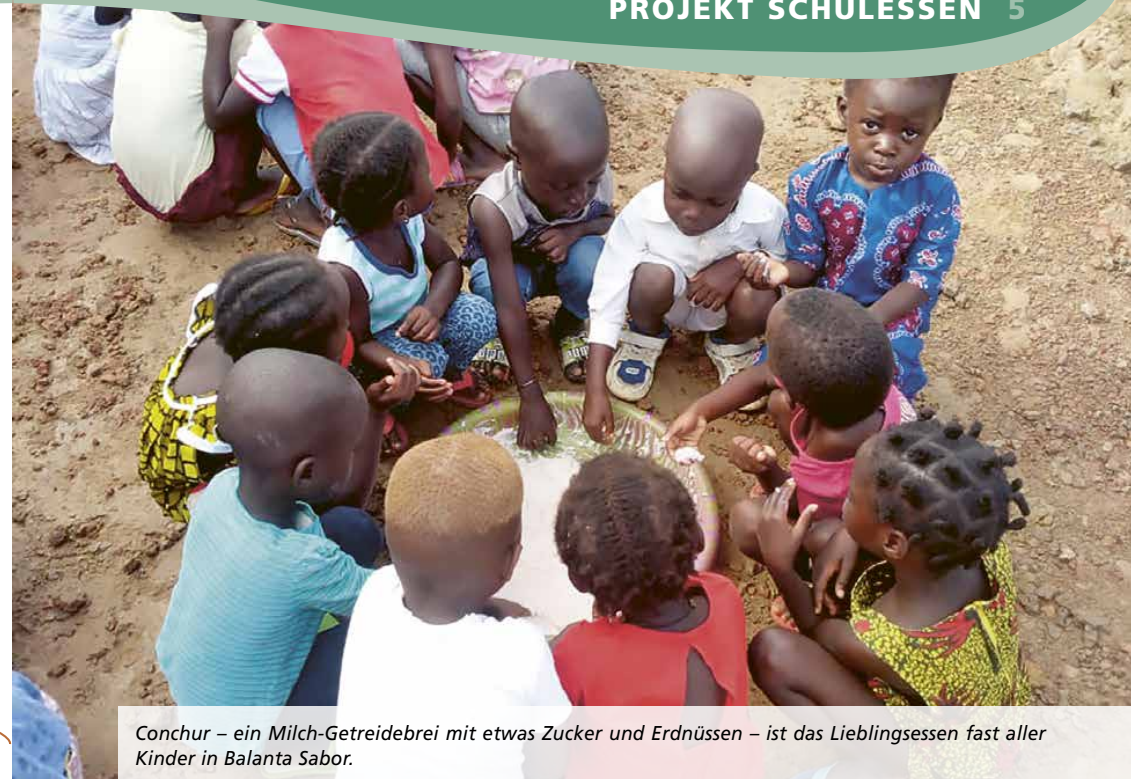
Conchur – ein Milch-Getreidebrei mit etwas Zucker und Erdnüssen – ist das Lieblingsessen fast aller Kinder in Balanta Sabor.