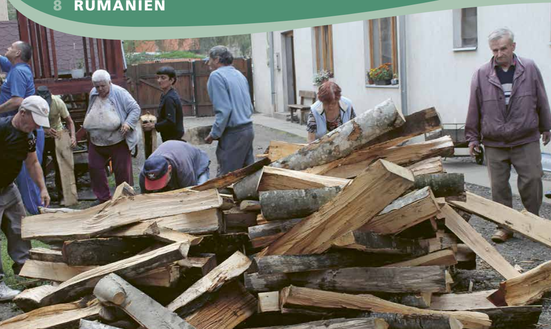
Das Kinder- und Obdachlosenheim sowie das Mutter-Kind-Zentrum in Gheorgheni konnten mit insgesamt 92 m 3 Brennholz versorgt werden.