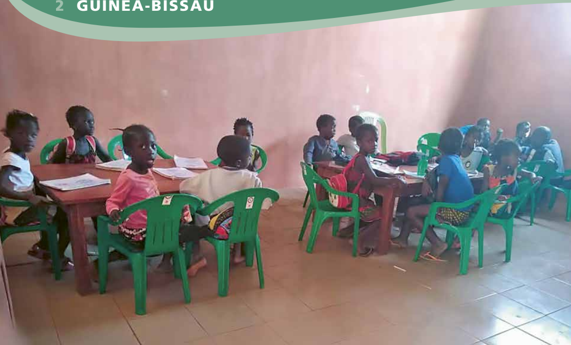
Die Kinder in Balanta Sabor können seit Ende 2021 die eigene Schule in ihrem Dorf besuchen.