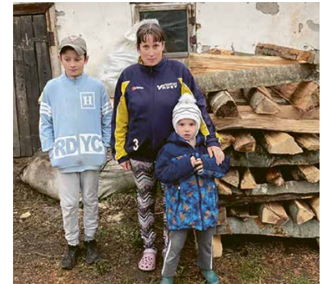
Familien erhielten neben einem Lebensmittelpaket je auch 1.5 m 3 Brennholz.

Aufgrund unserer Arbeit dort wissen wir, dass Mangel und Not zum Alltag der Menschen dazugehören und dass im Winter die Kälte zu einem weiteren Feind der Armen und Alten wird. Temperaturen von bis zu minus 30 Grad sind keine Seltenheit im Osten Rumäniens. Mit einer guten Stromversorgung, einem isolierten Holzhaus und genügend Brennholz eigentlich kein Problem. Aber in SILOAHs Projektgebiet ist die Realität eine andere. Viele Familien und besonders Senioren leben in reparaturbedürftigen Häusern oder Hütten ohne ausreichend Wasser-, Strom- und Gasversorgung, mit kaputten Fenstern, die weder vor Kälte noch vor Wind schützen. Brennholz war letzten Winter nicht ausreichend bis gar nicht vorhanden, weil keiner Geld übrig hatte, um welches zu kaufen. Denn allein nur für Lebensmittel mussten die Menschen 30 % mehr ausgeben als üblich.