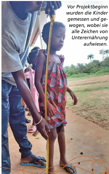
Vor Projektbeginn wurden die Kinder gemessen und gewogen, wobei sie alle Zeichen von Unterernährung aufwiesen.

Option 3: Werden Sie mit monatlich 30 Franken Pate dieses neuen Projekts und fördern Sie damit die regelmässige Versorgung der Kinder in der Schulkantine. Melden Sie sich bei Interesse bei uns: 031 982 01 03