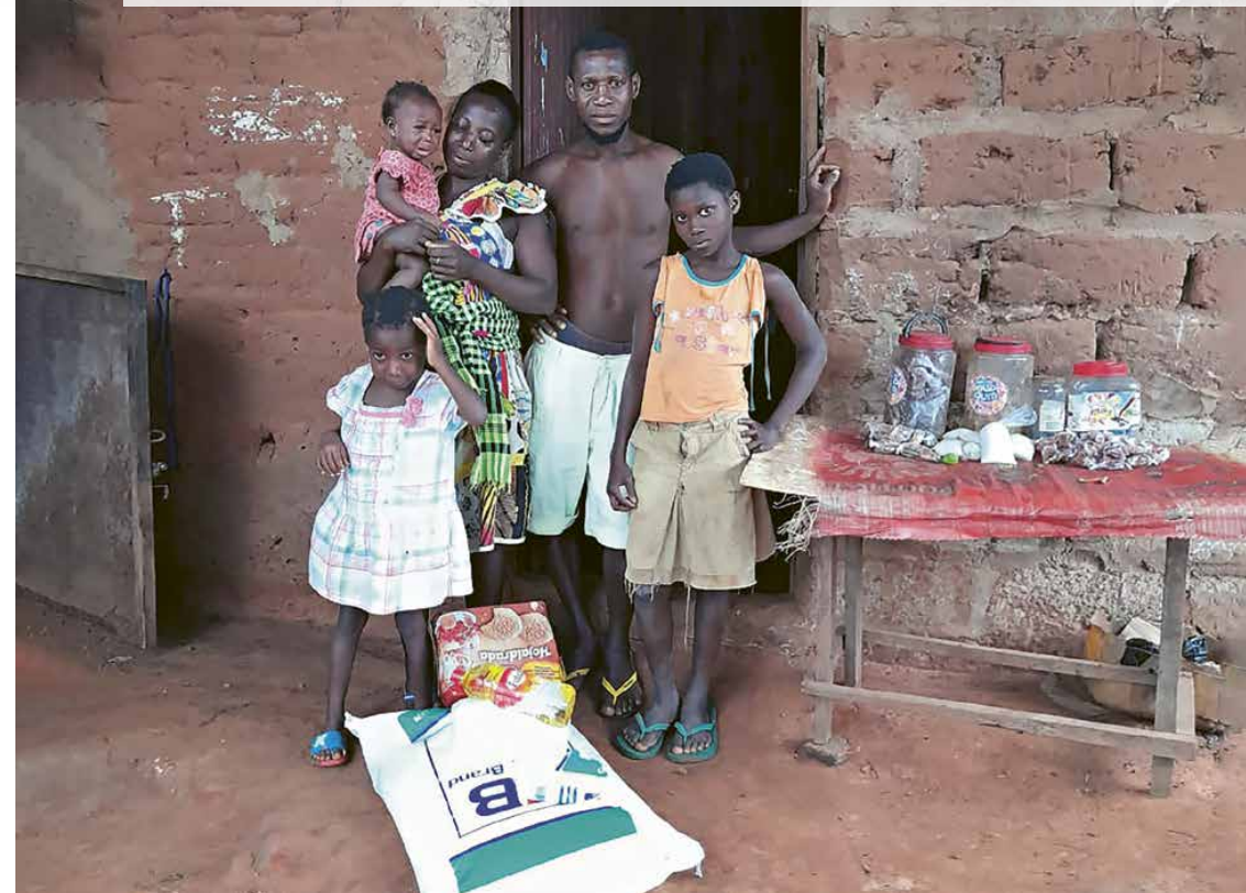
Bereits im 2022 konnte SILOAH den Familien in Balanta Sabor kurzfristig mit Lebensmitteln aushelfen.

regionalen Gebieten, wo auch Balanta Sabor gelegen ist, reicht der Eigenanbau nicht aus, um eine ganze Familie durchzubringen. Drei von zehn Guinea-Bissauern leben in Armut und jeder Dritte ist Analphabet. Alle Familien in Balanta Sabor – so musste SILOAH erfahren – haben weniger als umgerechnet 1.50 Franken pro Tag für ihr Auskommen zur Verfügung. Reis und Bohnen bilden die Basis der ohnehin einzigen Tagesmahlzeit der Dorfbewohner.